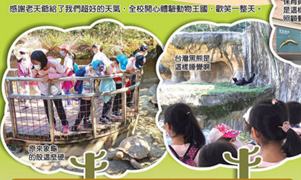
感謝老天爺給了我們超好的天氣，全校開心體驗動物王國，歡笑一整天。