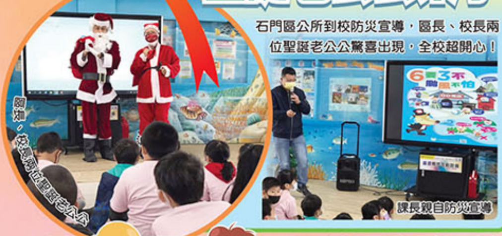
石門區公所到校防災宣導，區長、校長兩位聖誕老公公驚喜出現，全校超開心！