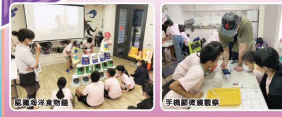
認識海洋食物鏈 手機顯微鏡觀察