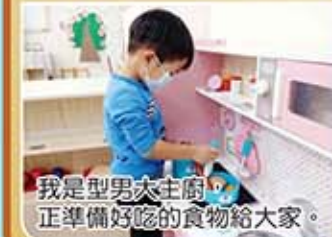
我是型男大主廚，正準備好吃的食物給大家。

藉由角色扮演、同儕互動的過程讓孩子練習口語表達與溝通，除了有助於建立社會互動技巧，也能從遊戲中了解不同道具的操作方式，以增進手部小肌肉發展。扮演區是小幼班孩子的熱門區，大家最喜歡扮演區了。