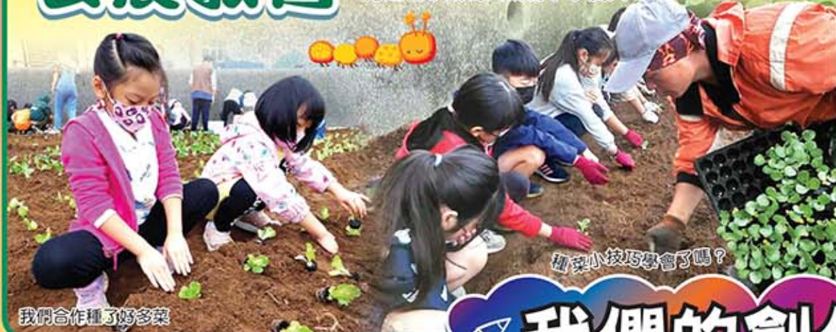
我們合作種了好多菜