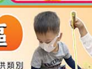
我們在玩拼圖遊戲，可邊閱讀邊玩遊戲。