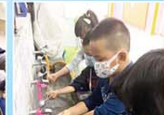
我們在學校採收金桔，先幫金桔清洗乾淨才能吃呢！