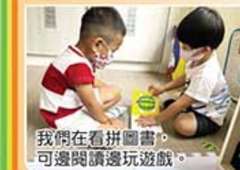
我們在玩拼圖遊戲，可邊閱讀邊玩遊戲。