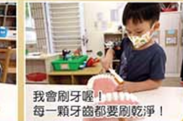
我會刷牙囉！每一顆牙齒都要刷乾淨！