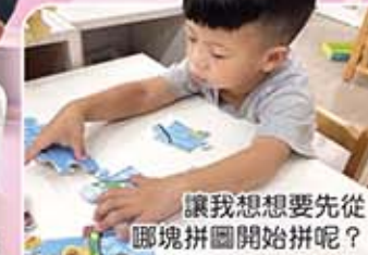
讓我們想想要先從哪塊拼圖開始拼呢？