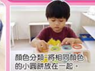
顏色分類，將相同顏色的小圓餅放在一起。