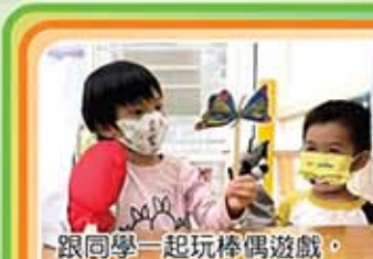
跟同學一起玩木偶遊戲，真好玩。