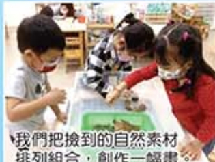
我們把撿到的自然素材排列組合，創作一幅畫。