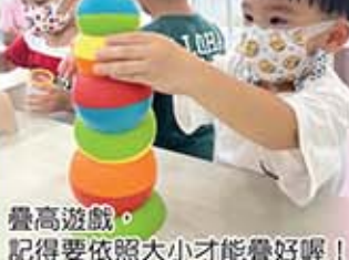
疊高遊戲，記得要依照大小才能疊好喔！

好玩的數學區裡有配對、對應、分類、序列的數學概念，孩子可藉由拼圖想辦法從中找邊、顏色及形狀分類，找出眼前的線索組合出目標，這個過程能刺激孩子建立自己的邏輯，有助於解決生活上的問題。