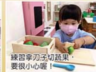
練習拿刀子切蔬果，要很小心喔！