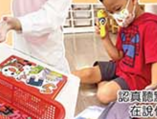
我們在玩拼圖遊戲，可邊閱讀邊玩遊戲。