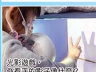
光影遊戲，你看手的影子像什麼？