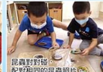
昆蟲對對碰，配對相同的昆蟲照片。