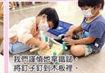
我們謹慎地拿鐵釘，將釘子釘到木板裡。