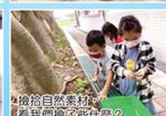
撿拾自然素材，看看我們撿了些什麼？