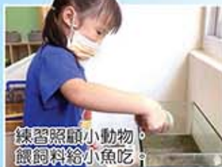
練習照顧小動物，餵飼料給小魚吃。

透過自然觀察遊戲與操作，培養孩子樂於研究的精神，並且結合戶外路查，讓孩子探索身邊的人事物，是孩子們最喜歡也最期待的活動。