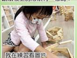
我在練習看圖片，搭建環型建築物。

大朋友小朋友都很喜歡玩積木區，因為在這裡能盡情發揮想像力搭建心目中的城堡、動物園、大船等，搭建的過程中，孩子會互相討論如何搭建與堆疊，即使倒塌了也仍然努力不懈持續建造，看見孩子互助合作、互相鼓勵的樣子，真是太棒了！