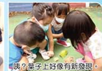
咦？葉子上好像有新發現。