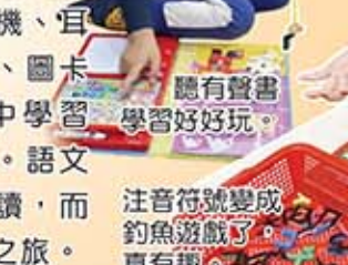
我們在玩拼圖遊戲，可邊閱讀邊玩遊戲。