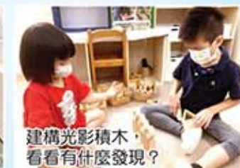
建構光影積木，看看有什麼發現？