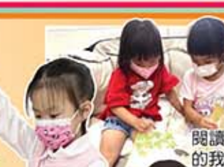
我們在玩拼圖遊戲，可邊閱讀邊玩遊戲。