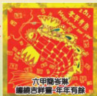
六甲簡岑琳 繡繡吉祥圖-年年有餘