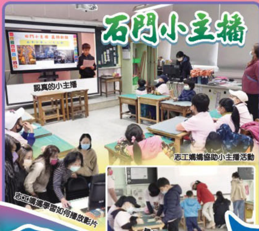
謝謝途中各點的志正媽媽