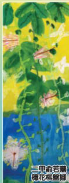
三甲俞若麟 種花棋盤腳