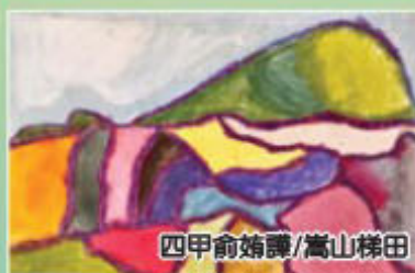
四甲俞嬌譚/高山梯田