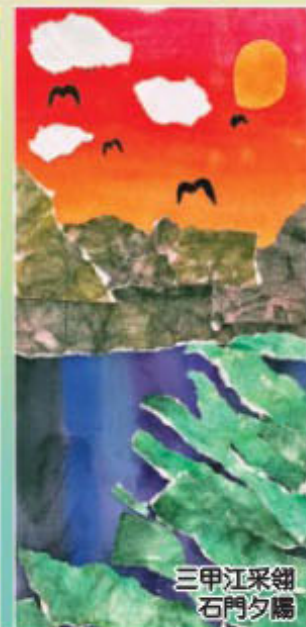
三甲江采翎 石門夕陽